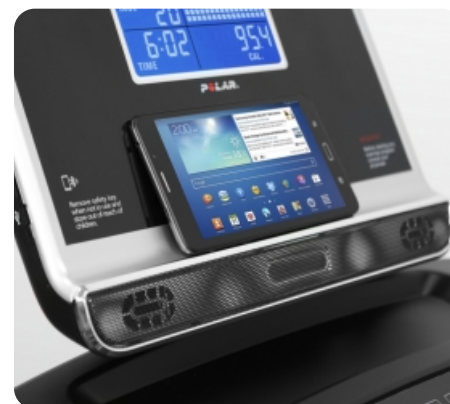
Подставка для гаджетов