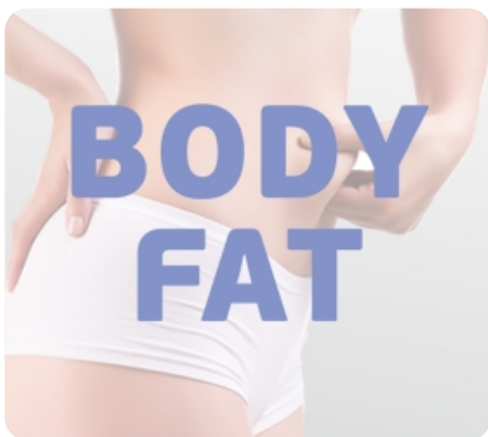
Режим жиранализатора Body Fat для определения комплекции организма