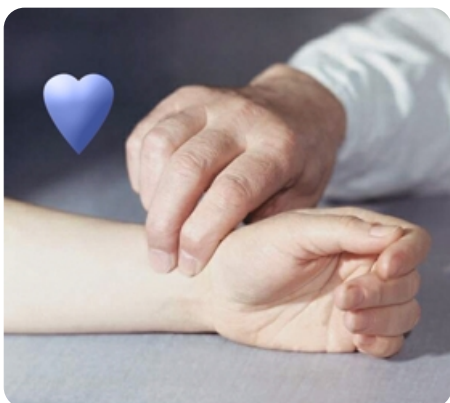
3 пульсозависимые программы