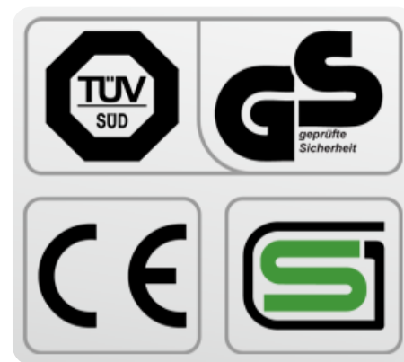
Обязательные сертификаты: европейский CE, немецкий GS TÜV, японский SG