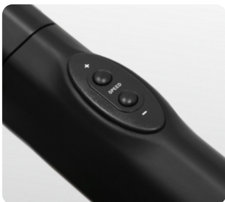
Дополнительные кнопки переключения наклона и скорости