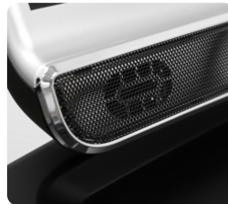
Встроенные динамики мощностью 5 Ватт