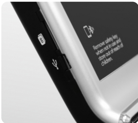
Воспроизведение аудио при помощи AUX IN, AUX OUT, USB и SD-Card