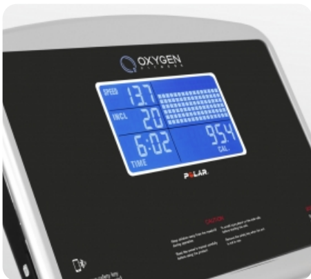
7 дюймовый (17,5 см) голубой многофункциональный LCD дисплей