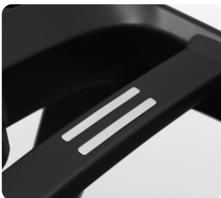
Сенсорные датчики пульса